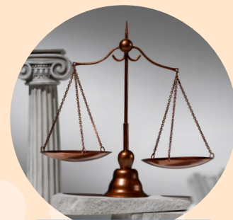
社會對預設醫療指示立法 仍未有共識

在以人為本的基礎下，Bamford Review 建議整合一套適用於每個人的法律框架，消除對有精神健康需要及有智力障礙人士的歧視。最終在 2016 年，The Mental Capacity Act (NI) 2016 正式通過，假設所有人都有心智能力作決定，並為有精神健康需要或有智力障礙人士建立法定框架協助他們作決定，以及準備當失去心智能力時仍能保障其自主權、自由、以及可委託代理人作財務及醫療決定 4 。這法例為持久授權書定立法律框架，亦要求檢討與預設醫療指示相關的法例 5 。在 2019 年，衛生部表示如果拒絕維持生命治療的預設決定有效，醫護必須執行，但因為社會對預設醫療指示立法仍未有共識，所以維持由普通法框架下推行 6 。