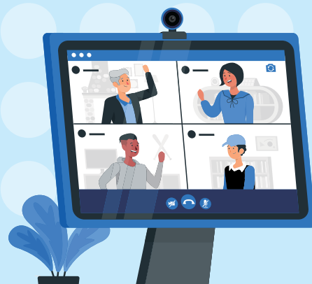
安老院舍服務網絡會議

此期紓緩及晚期照顧服務資訊，我們透過訪問三所香港的護理安老院，及參與社聯的安老院舍服務網絡會議，綜合了約三十所院舍的同工代表對執行院舍離世及提供晚期照顧服務面對的困難。另外，我們亦參訪一所私營安老院舍，了解她如何為末期病人提供晚期照顧服務。