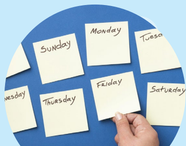
院舍面對人手短缺及工作量