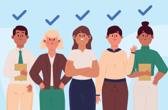
需要設立專責團隊跟進該晚期病人及其家屬的個案