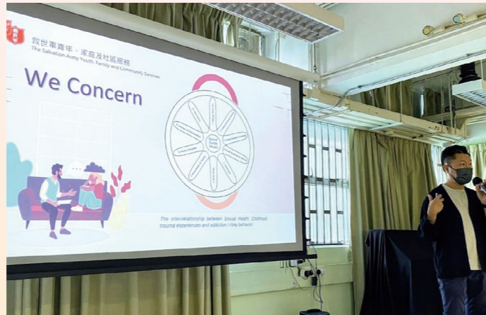
「零點三七」按服務對象需要，製作本地性教育教材。