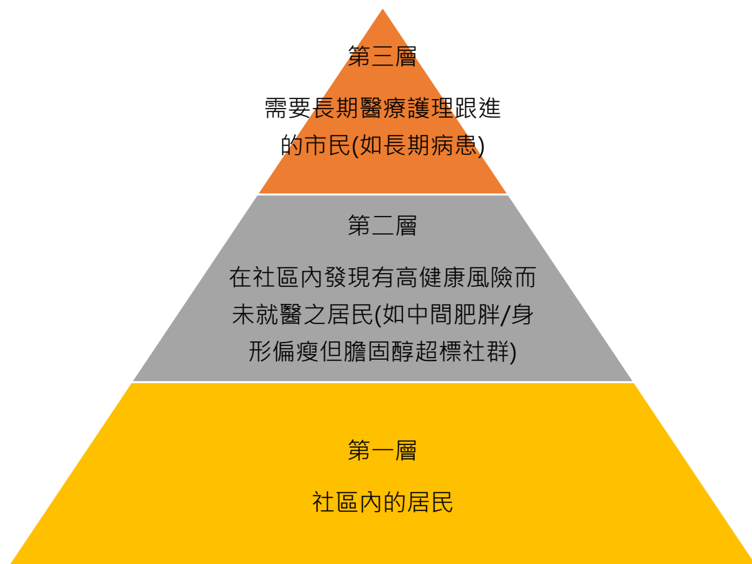
圖一：康健中心的服務對象

2.5. 食衛局構想三層服務重點，包括提供健康資訊、健康評估，及病患者個案管理。社聯認同這幾項服務重點，但認為有效提供這服務，社工專業介入十分重要(見圖二)